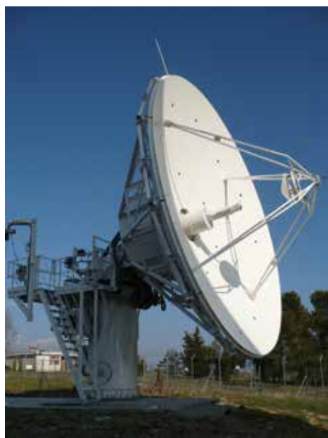
Station sol de Bram M48.

Grâce à Athena-Fidus, la défense française disposera début 2014 - pour une notification intervenue le 9 février 2010 - d'une capacité en bande Ka militaire. Ce saut technologique offre une couverture globale