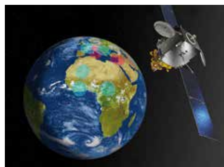
Les zones de couverture du satellite Athena Fidus.

fréquence (réflecteur, sources, équipements radiofréquences, etc.) ont constitué une part très importante de ces développements réutilisés pour les applications militaires, ce ne sont pas les seuls. Les concepts systèmes (architecture, techniques de transmission par modulation et codage adaptatives compatibles avec les atténuations en bande Ka, modèles de dimensionnement) ont été élaborés pour les usages commerciaux puis utilisés pour le meilleur dimensionnement de l'application militaire.