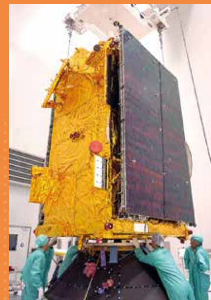
Pose du satellite Syracuse 3B sur l'Adaptateur de Charge Utile (ACU) du lanceur Ariane 5.

L'objectif principal est de soutenir les liaisons par satellite des forces armées des deux pays, en anticipant l'évolution de leurs besoins dans les années à venir. Comme ses prédécesseurs, le nouveau satellite fournira des liaisons stratégiques et tactiques, aussi bien sur les territoires nationaux que sur les théâtres d'opérations à l'étranger, en soutien à toutes les plateformes terrestres, navales et aériennes, qui pourront ainsi fonctionner comme un réseau intégré unique.