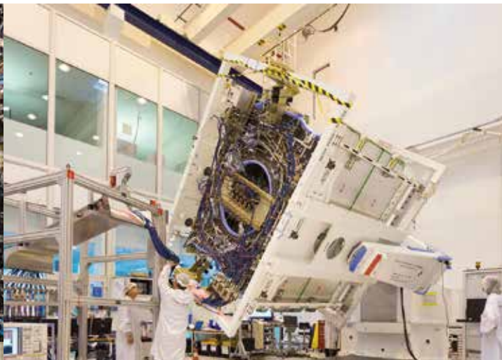
Charge Utile Athena-Fidus en salle d'intégration chez Thales Alenia Space.