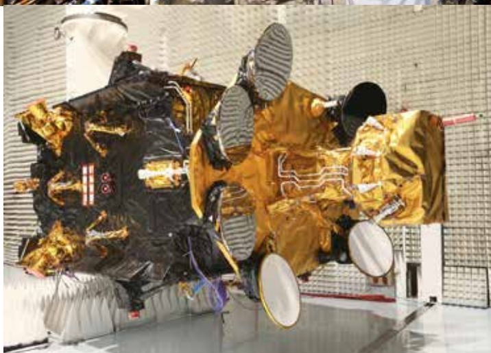
Préparation du satellite Athena-Fidus chez Thales Alenia Space à Cannes.